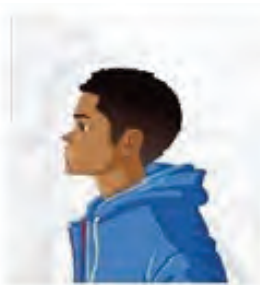
Figura 2. Modelo de Foto de Perfil

IV - um vídeo individual recente (tamanho máximo 20MB), de até 30 segundos de duração, aparecendo do pescoço para cima, mostrando o rosto de frente (devendo o candidato estar vestido), no qual o candidato deverá falar: EU, "FALE SEU NOME COMPLETO", ME AUTODECLARO PRETO(A) OU PARDO(A);