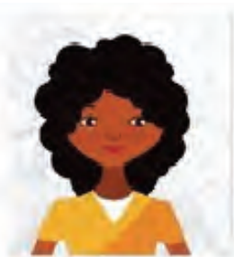
Figura 1. Modelo de Foto Frontal